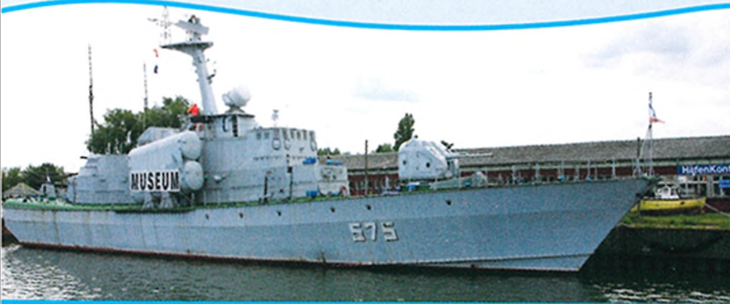
Das Raketenschellboot aus der Tarantul-Reihe das von 1986 bis 1990 auf der Ostsee im Einsatz war, wird als Museumsschiff betrieben.