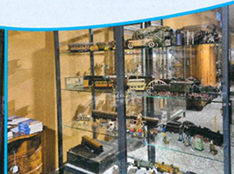
Spielzeugsammlung, Spielzeuge bis 1950