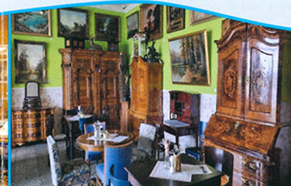
Ein großer Antikladen vervollständigt das Ensemble.