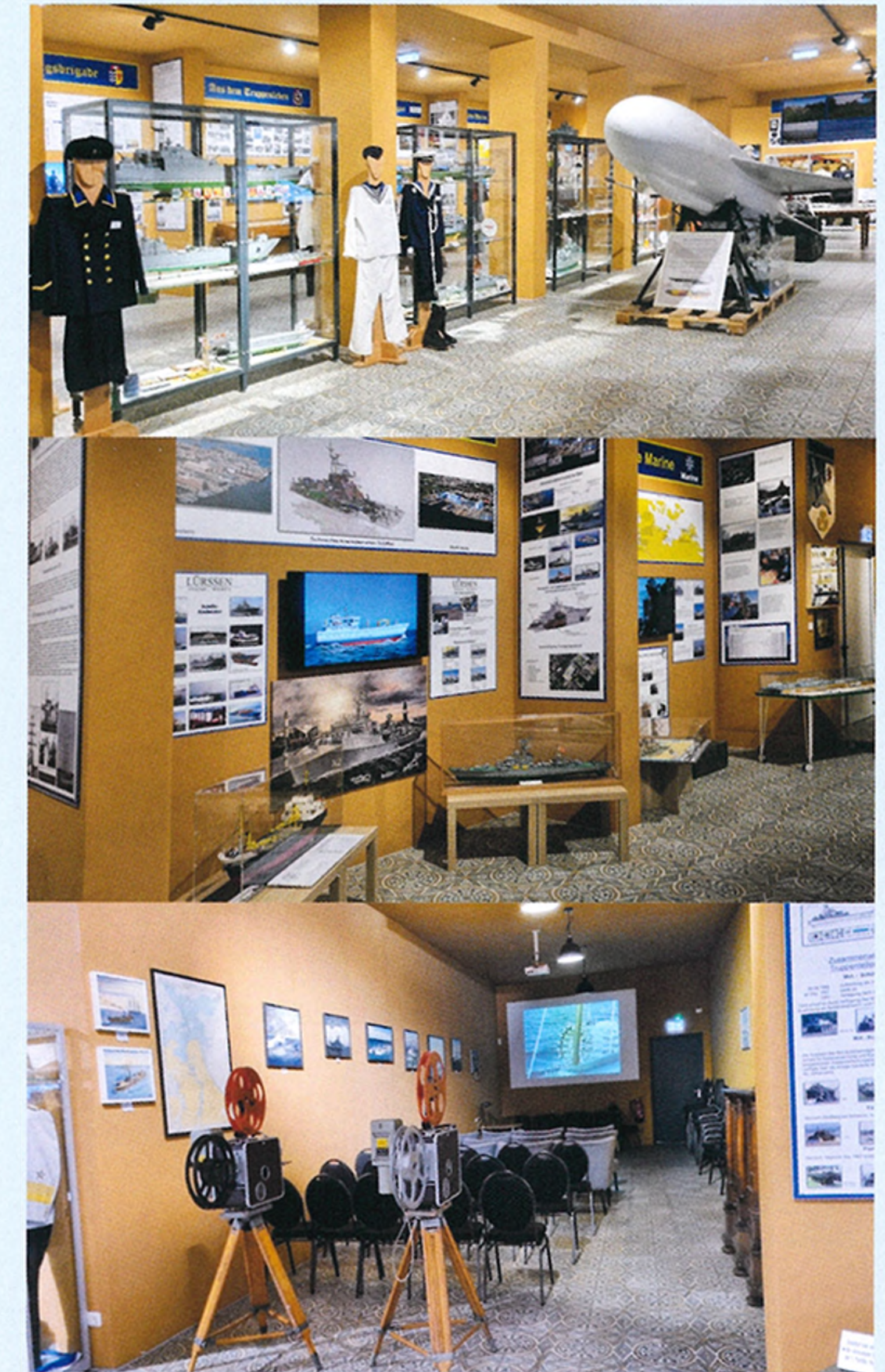
Vortragsraum Hier werden Vorträge zu maritimen Themen und zur Geschichte von Peenemünde angeboten.