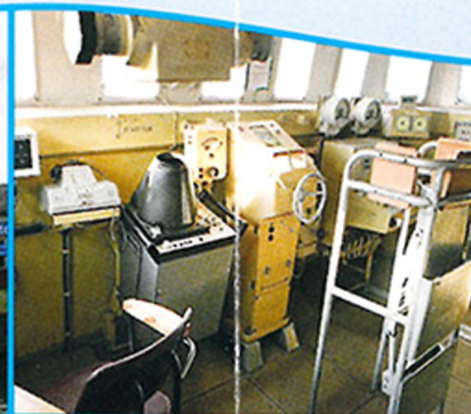
Brücke mit Ruderstand, Navigationsradar und Steuerpult für Turbinen