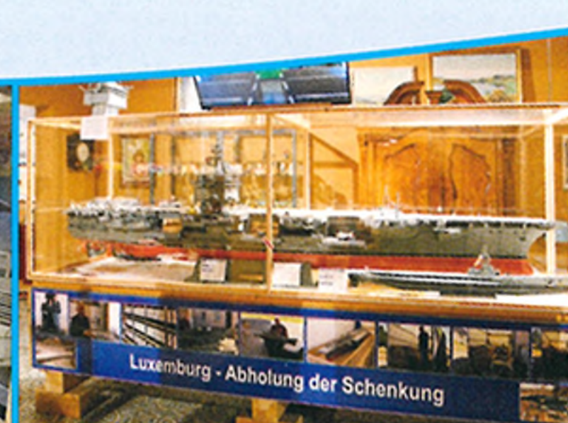
Modell im Maßstab 1:100 des amerikanischen Flugzeugträgers CVN 65 USS „Enterprise“